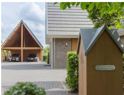
Tekst bij foto (test)

Laan van Westroijen 6 4003 AZ Tiel (0345) 59 62 10