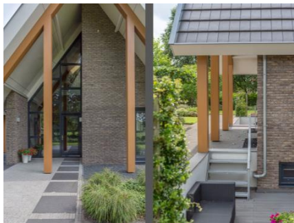
Tekst bij foto (test)