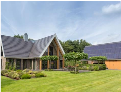
Tekst bij foto (test)