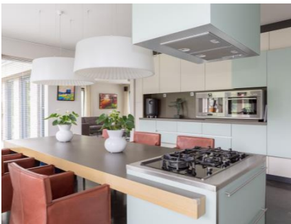
Tekst bij foto (test)