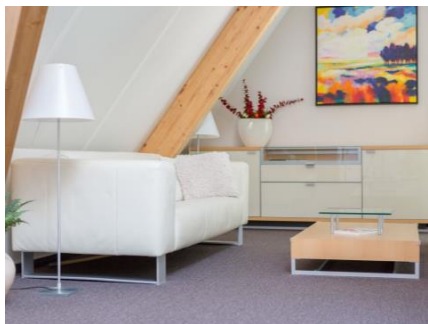
Tekst bij foto (test)