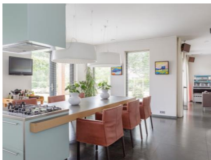
Tekst bij foto (test)