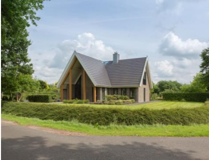
Tekst bij foto (test)