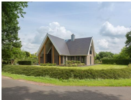
Tekst bij foto (test)